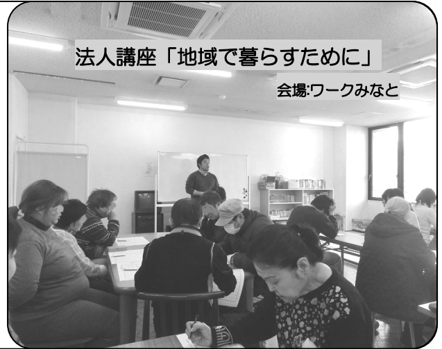
法人講座「地域で暮らすために」

地域活動では、3月7日(土)「第9回みなとふれあい福祉のひろば」ポートネットのバザーコーナーで、ワークみなとは東日本大震災被災地応援で福島県いわき市「希望の杜福祉会・杜のドーナツ」を、グリーンズは手作りケーキの販売をさせて頂きました。雨で寒かったにもかかわらず、多くの方に来ていただき、楽しい時間を一緒に過ごしました。