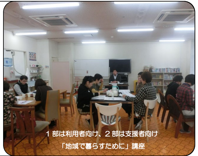
1部は利用者向け、2部は支援者向け 「地域で暮らすために」講座