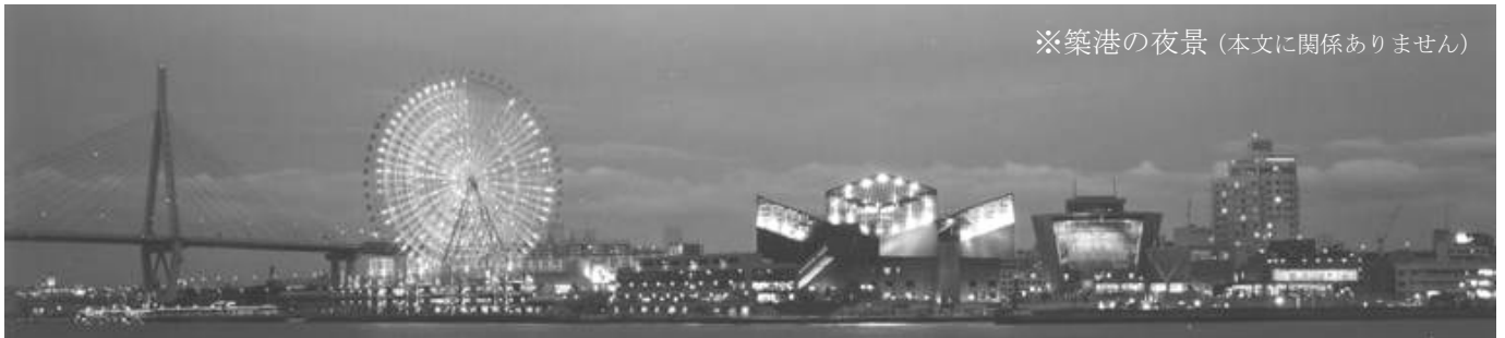
※築港の夜景（本文に関係ありません）

▼3月に入ってから、上記の価格変更をお客さんにお知らせしたのですが、いわゆる「駆け込み需要」で、グリーンズのランチの回数券が、ものすごい勢いで売れています。4月に入ってから買えば、1食780円相当ですが、3月中だと700円なので（その差80円）、常連のお客さんは、数セットまとめ買いされる方もいます。おかげで今月の売り上げはかなりあがっているのですが、そのぶん年度明けの現金収入は確実に減ってしまうので、本当に良し悪しです。▼きっと4月5月あたりの売り上げは厳しいはずですが、お客さんに価格分の満足感を得ていただけるよう、頑張っていきたいと思っています。