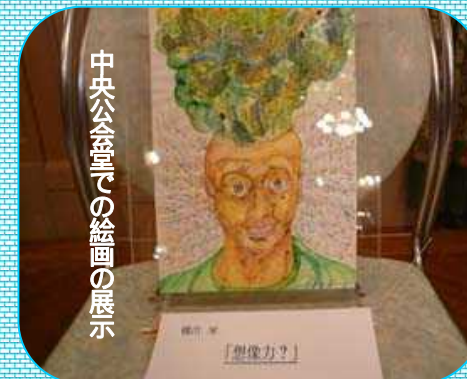
中央公会堂での絵画の展示