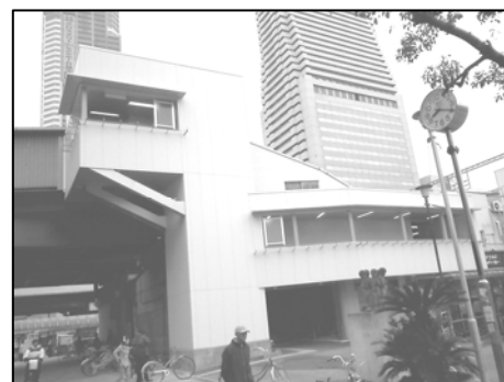
(左方向地下鉄弁天町駅・右方向JR弁天町駅)

大阪市営地下鉄とJRの弁天町を結ぶ通路にエレベーターが設置されました。 地上、JR改札のある2階、地下鉄改札のある3階を結ぶもので、階段の大変な高齢者・乳母車や車イス等も気軽に利用できます。